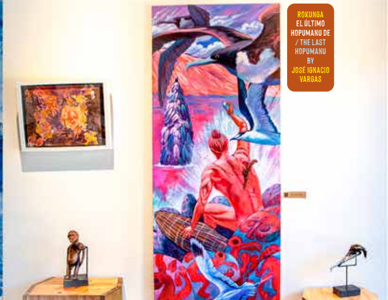
ROKUNGA EL ÚLTIMO HOPUMANU DE / THE LAST HOPUMANU BY JOSÉ IGNACIO VARGAS