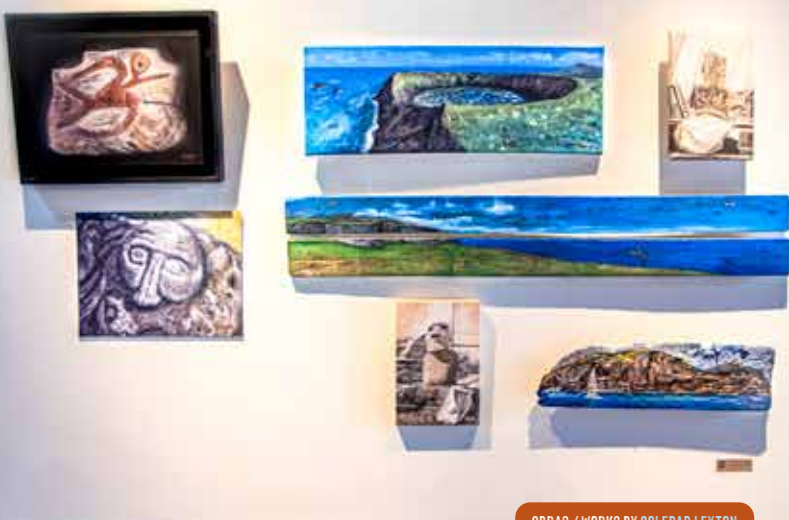
OBRAS / WORKS BY SOLEDAD LEYTON