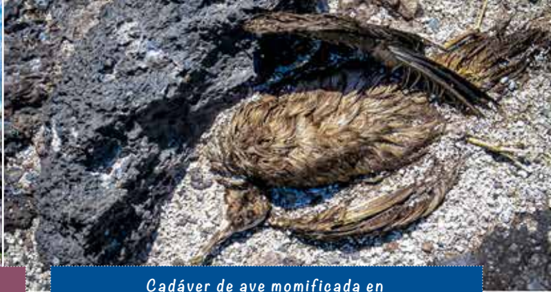
Cadáver de ave momificada en / Mummified bird carcass on Motu Motiro Hiva

dado origen a microhábitats altamente específicos que proporcionan sitios de nidificación para aves marinas y albergan una comunidad de invertebrados en gran medida poco caracterizada. De cara al futuro, documentar la biodiversidad de este Motu es esencial para comprender la fragilidad y singularidad de este ecosistema.