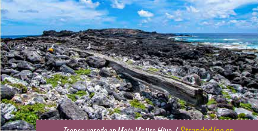
Tronco varado en Motu Motiro Hiva / Stranded log on Motu Motiro Hiva