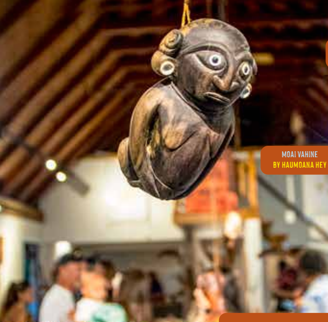
MOAI VAHINE BY HAUMOANA HEY