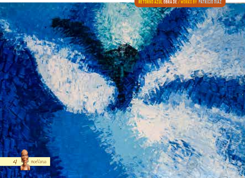
RETORNO AZUL OBRA DE / WORKS BY PATRICIO DIAZ