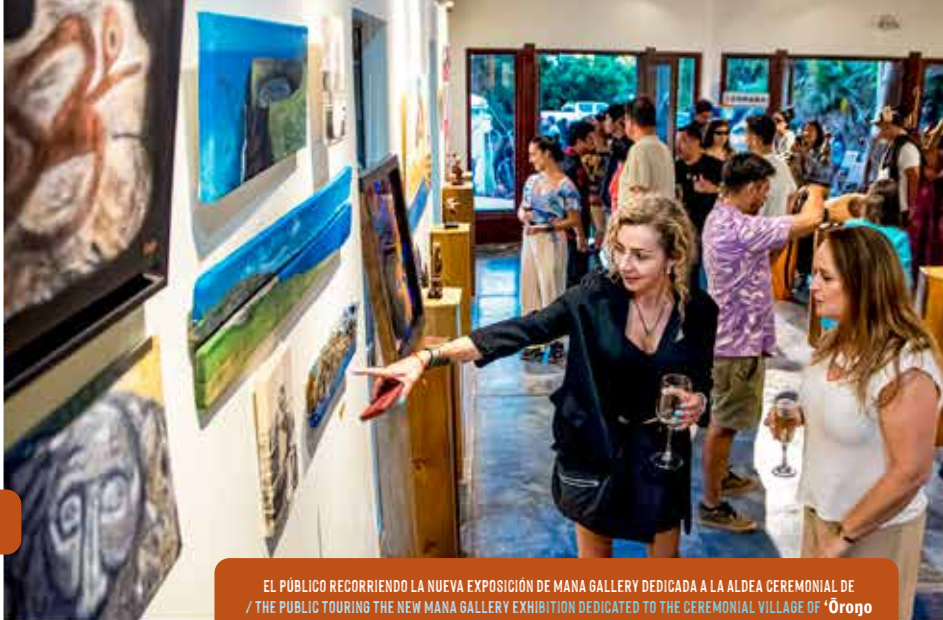
EL PÚBLICO RECORRIENDO LA NUEVA EXPOSICIÓN DE MANA GALLERY DEDICADA A LA ALDEA CEREMONIAL DE / THE PUBLIC TOURING THE NEW MANA GALLERY EXHIBITION DEDICATED TO THE CEREMONIAL VILLAGE OF 'ŌROŌ

En el extremo suroeste de Rapa Nui, donde el borde del cráter del Rano Kau se encuentra con el abismo del Pacífico, el sitio ceremonial de 'Ōroŋo permanece como un testigo frágil de la historia de la isla. No es solo un conjunto de casas de piedra suspendidas entre el océano y la memoria; es el núcleo donde se gestó el sistema político del Tarjata Manu (Hombre-Pájaro) y donde se concentra la mayor densidad de arte rupestre de todo el territorio. Sin embargo, este centro neurálgico de la cultura enfrenta hoy un enemigo silencioso y devastador: la erosión y el paso implacable de los elementos.