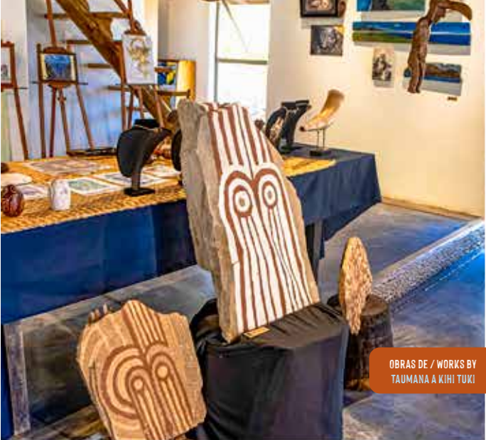
OBRAS DE / WORKS BY TAUMANA A KIHU TUKI