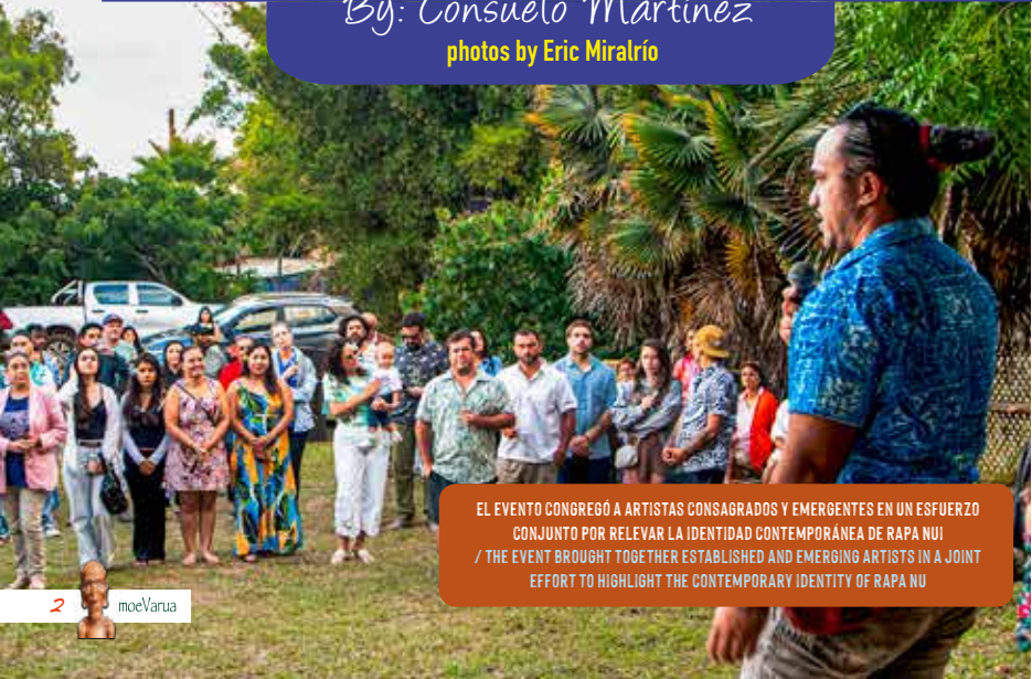
EL EVENTO CONGREGÓ A ARTISTAS CONSAGRADOS Y EMERGENTES EN UN ESFUERZO CONJUNTO POR RELEVAR LA IDENTIDAD CONTEMPORÁNEA DE RAPA NUI / THE EVENT BROUGHT TOGETHER ESTABLISHED AND EMERGING ARTISTS IN A JOINT EFFORT TO HIGHLIGHT THE CONTEMPORARY IDENTITY OF RAPA NU

By: Consuelo Martínez