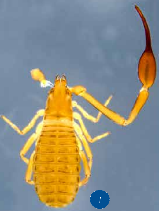
1) Pseudoescorpión del género Garypus / Pseudo-scorpion of the genus Garypus 2) Ejemplar hembra del nuevo género y especie de Motuchernes / Female specimen of the new genus and species of Motuchernes 3) Ejemplar macho del nuevo género y especie de Motuchernes / Male specimen of the new genus and species of Motuchernes

This story began years before this discovery. During routine surveys in 2014 and 2015 focused on monitoring the seabird nesting colony on Motu Motiro Hiva, invertebrate species associated with little-explored microhabitats were collected. Thriving populations of Motuchernes spatiodigitus were found