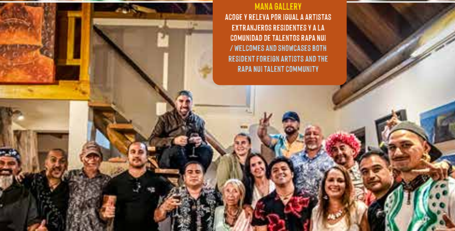
MANA GALLERY ACOGE Y RELEVA POR IGUAL A ARTISTAS EXTRANJEROS RESIDENTES Y A LA COMUNIDAD DE TALENTOS RAPA NUI / WELCOMES AND SHOWCASES BOTH RESIDENT FOREIGN ARTISTS AND THE RAPA NUI TALENT COMMUNITY