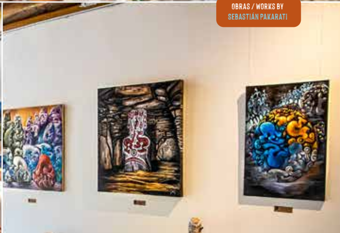
OBRAS / WORKS BY SEBASTIÁN PAKARATI