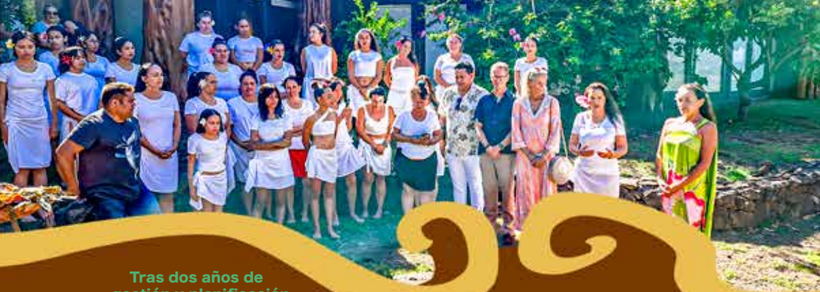
Tras dos años de gestión y planificación, se concretó en Rapa Nui un encuentro técnico de alto nivel para la formación en / After two years of arrangement and planning, a high-level technical meeting was held in Rapa Nui for training in Ori Tahiti